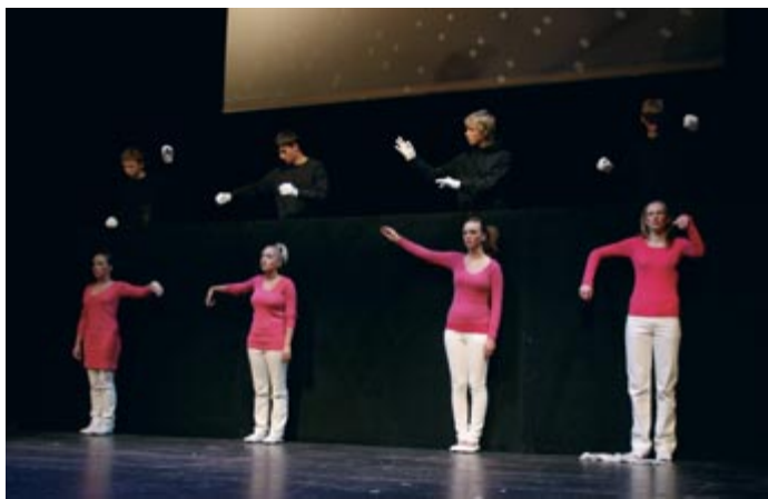
Eröffnungszereemonie "Vom Suchen und Finden des Spiels" mit Studierenden des Darstellenden Spiels und Schülern.

Der Frage, wie das pädagogische und therapeutische Potential des Theaterspiels in sonderpädagogischen Zusammenhängen und sozialen Feldern anwendbar ist, um Risiken im individuellen Bereich (z.B. Erkrankung), in familiärer Umgebung (z.B. Gewalterfahrung) sowie im weiteren sozialen Umfeld (z.B. Armut) zu begegnen, näherten sich Pädagogen, Theaterschaffende, Therapeuten, Sozialarbeiter, Psychotherapeuten aber auch Studierende aus unterschiedlichsten Blickwinkeln. In Keywords, Workshops und Referaten wurde die Thematik aus wissenschaftlicher und praktischer Sicht beleuchtet, versehen mit den jeweiligen Erfahrungen aus regionen- und problemspezifischen Projekten. So berichtete zum Beispiel Mercy Mirembe Ntangaare über Kindertheater in Uganda, Dr. Christine Hatton aus Australien referierte über „class-