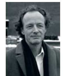
Beat Furrer – Komposition