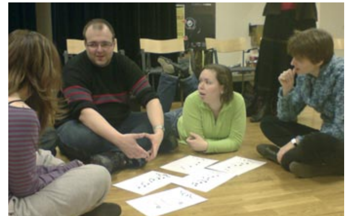
Gemeinsam wird der Musikunterricht geplant.

zipierten Stunden werden mit Freude und Interesse angenommen. Da die Studierenden an zwei Tagen unterrichten, können Fehler korrigiert, Konzepte überdacht und Vergleiche gezogen werden. Diese Erfahrungen bedeuten für die Studierenden eine wertvolle Horizonterweiterung.