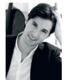
Daniel Müller-Schott – Violoncello