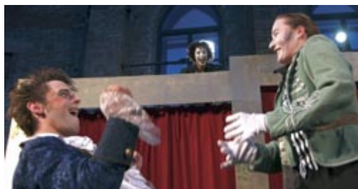
Im Sommer 2008 war der Klosterinnenhof Kulisse für das Stück "Was ihr wollt".

24.07.2009, 21.00 Uhr, Innenhof der HMT 25.07.2009, 21.00 Uhr, Innenhof der HMT 26.07.2009, 21.00 Uhr, Innenhof der HMT 27.07.2009, 21.00 Uhr, Innenhof der HMT