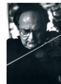
Saschko Gawriloff – Violine