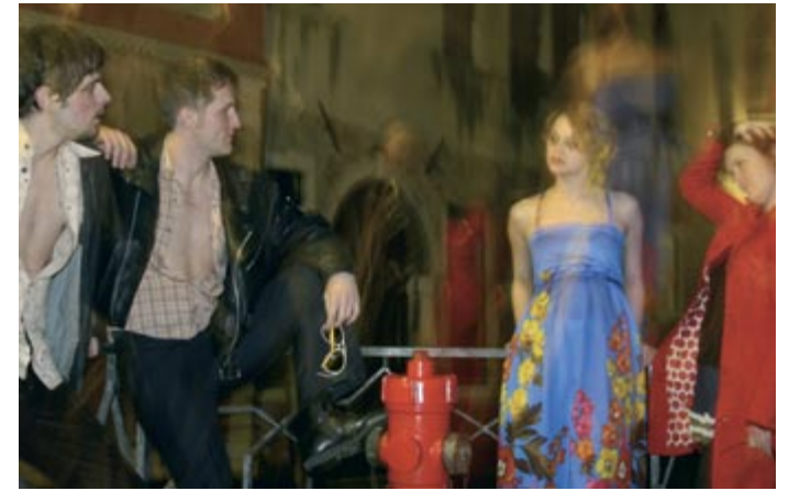
Ensemble "Leonce und Lena".

Dabei geht es dem Gastregisseur Reinhard Göber darum, dass sich die Studierenden kritisch mit dem Stück und ihrer eigenen Lebenssituation auseinandersetzen. Wo gibt es authentische Schnittpunkte? Was bleibt historisch gesehen von Büchners Stück übrig und hält es den Spagat zur Gegenwart aus? Es geht um Aufbruch und Grenzüberschreitungen. Doch nicht nur im spielerisch-