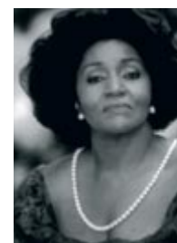
Grace Bumbry – Gesang