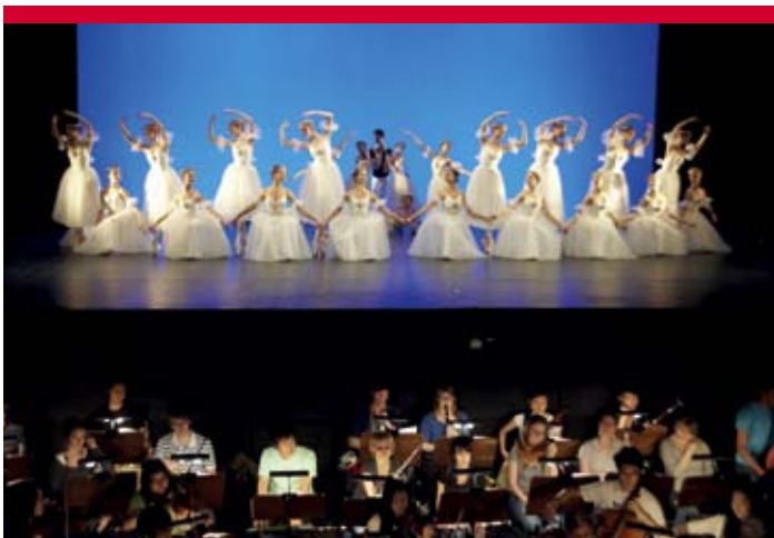
Generalprobe der Ballettgala | Foto: Thomas Häntzschel/Fotoagentur Nordlicht

Mit großem Erfolg wurde im Juli 2011 zum ersten Mal eine Ballett-Gala im Katharinenaal der hmt präsentiert. Dies gelang in Kooperation mit der Staatlichen Ballettschule Berlin, deren Studenten eigens für diese Einstudierung anreisten.