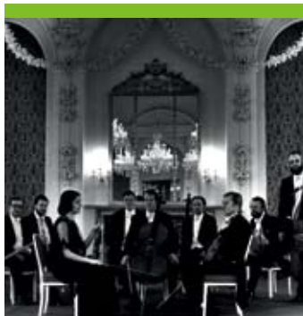
Das Rostocker Nonett