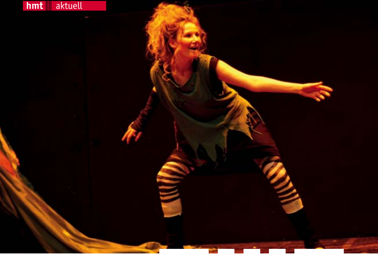
Szene aus der Veranstaltung „Theater? Mit mir?!“